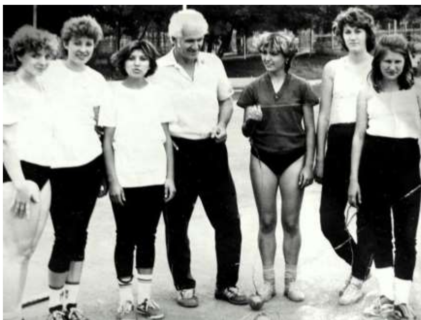
Студентки института физкультуры задолго до официального признания метание молота олимпийским видом с удовольствием осваивали азы техники.